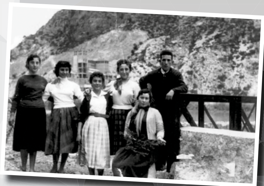
La Fogasseta, abril de 1958

En finalitzar el ball discoteca mòbil amb DJ Alex Blay. Col·labora: Associació de Joves de Xerta.