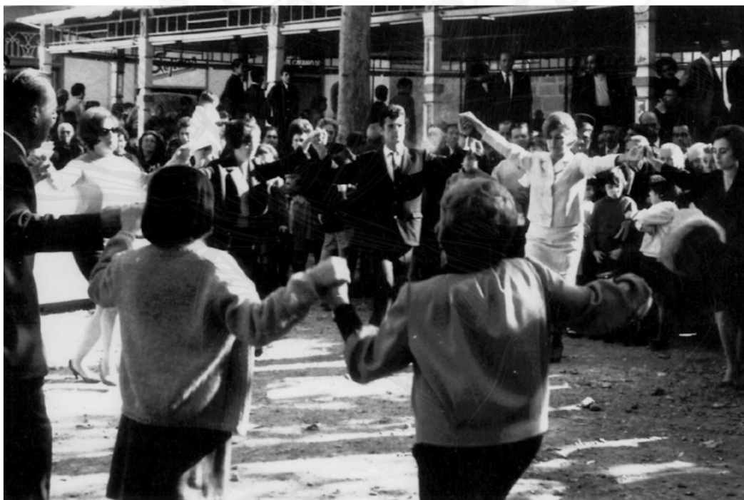
Ballada de sardanes davant els autos de xoc