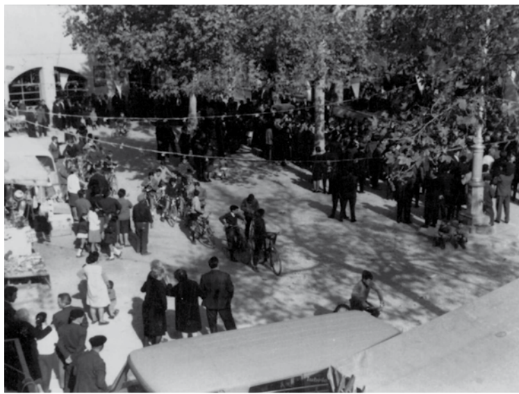
Traca a la plaça Major any 1966