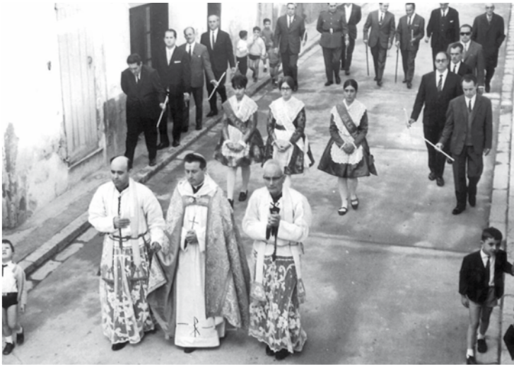
Processó any 1969