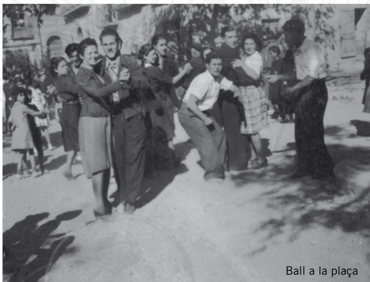
Ball a la plaça